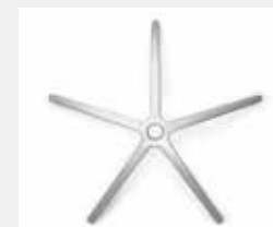
FHAP Aluminium poliert (Option) Aluminium polished (option)