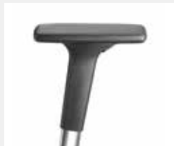
A441APO (4F) Armauflagen PU soft Armpads PU soft