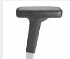
A442APO (4F) Leder-Armauflagen Leather armpads