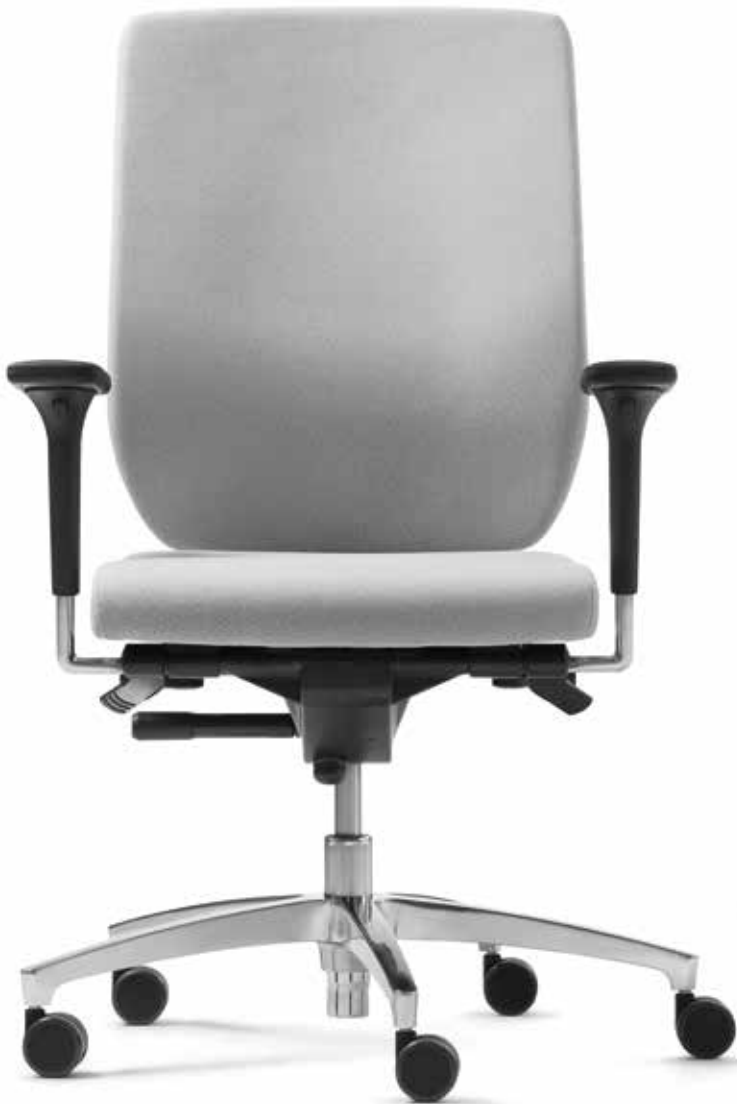
SD BC 2910 + Armlehnen | Armrests A341APO

The Bionic swivel chairs with a high, 10 cm height-adjustable backrest can also be equipped with an Ergo neckrest. The plastic outer shell with attractive structuring surrounds and protects the backrest upholstery in an ideal manner. The backrest upholstery can be changed without the use of tools, making it service-friendly.