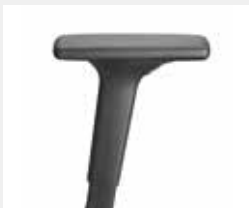
A441KGS (4F) Armauflagen PU soft Armpads PU soft