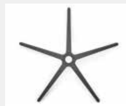
FHKG Kunststoff schwarz (Standard) Black plastic (standard)