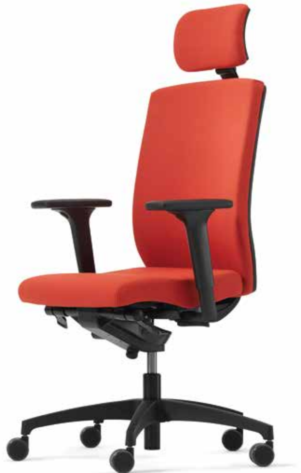
SD BC 2930 + Armlehnen | Armrests A441KGS