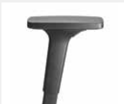
A240KGS (2F) Armauflagen PU Armpads PU