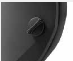
Mechanisch tiefenverstellbar (3,5 cm) Mechanically depth-adjustable (3.5 cm)