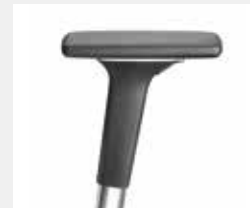
A541APO (5F) Armauflagen PU soft Armpads PU soft

*mit antibakterieller Mikrosilberausrüstung zum Schutz vor Infektionen with antibacterial microsilver finish to help prevent infections